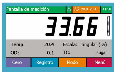
ADP400 que muestra parámetros de lectura a 20° C